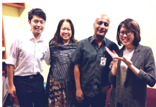
KIP(クアラルンプール・インターンシップ・プログラム)